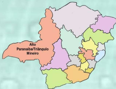
Figura 1 - Mapa de Minas Gerais, indicando a região estudada: Alto Paranaíba.

A região de planejamento do Alto Paranaíba é composta por 31 municípios (Minas Gerais, 2010).