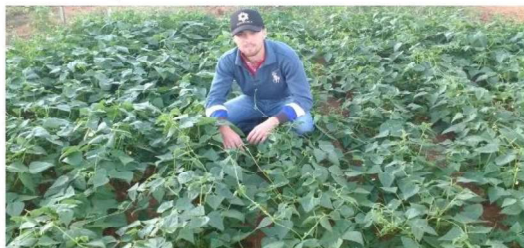
Foto 1: Área experimental, cultura implantada.

O objetivo desse trabalho foi avaliar formas que possam aumentar a quantidade de nitrogênio fixado biologicamente na cultura do feijoeiro.