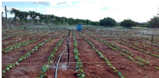
Foto 2: Sistema de irrigação e orientação das linhas de plantio.

Os dados foram submetidos ao teste de tukey ao nível de 5% de significância.